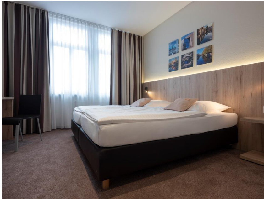
Bild 1: Durch den Einsatz heller Farben strahlen die KreativSchub-Zimmer in neuem Glanz. Der Holzton versprüht zudem eine dezente Gemütlichkeit. Die Bilder zeigen Aufnahmen aus Nürnberg zum Thema #reflektionen.